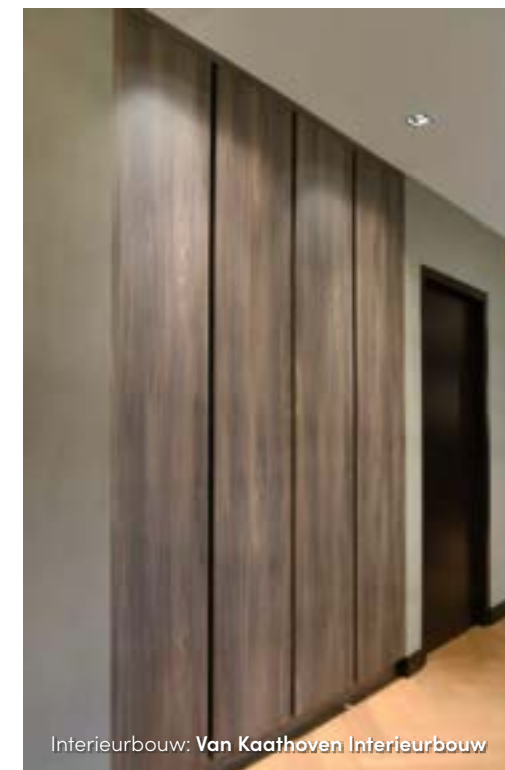
Interieurbouw: Van Kaathoven Interieurbouw