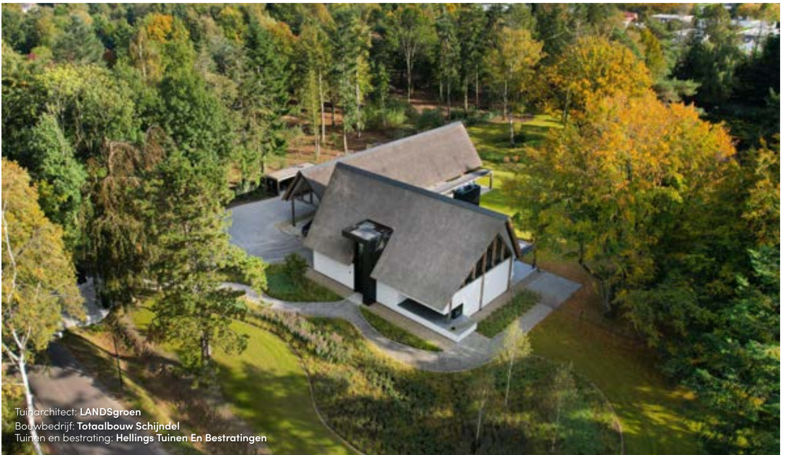
Tuinarchitect: LANDSgroen Bouwbedrijf: Totaalbouw Schijndel Tuinen en bestrating: Hellings Tuinen En Bestratingen