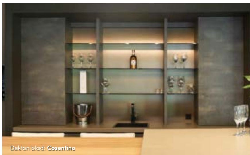
Dekton blad: Cosentino