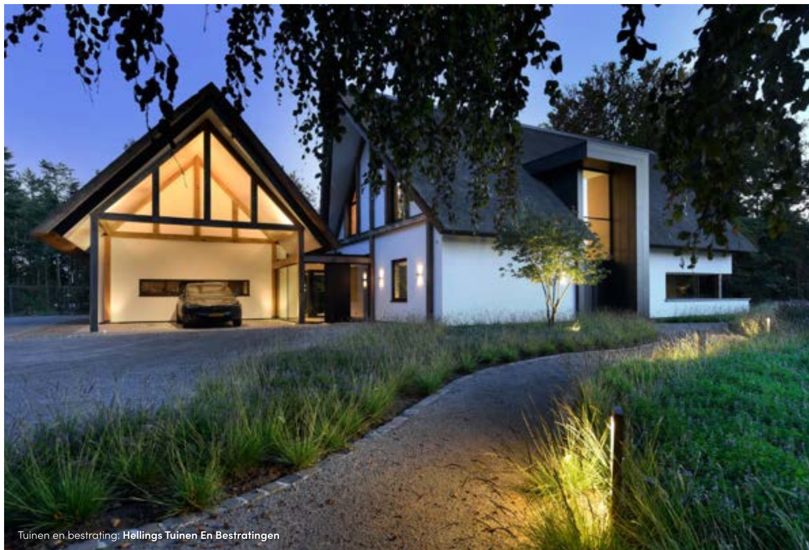
Tuinen en bestrating: Hellings Tuinen En Bestratingen