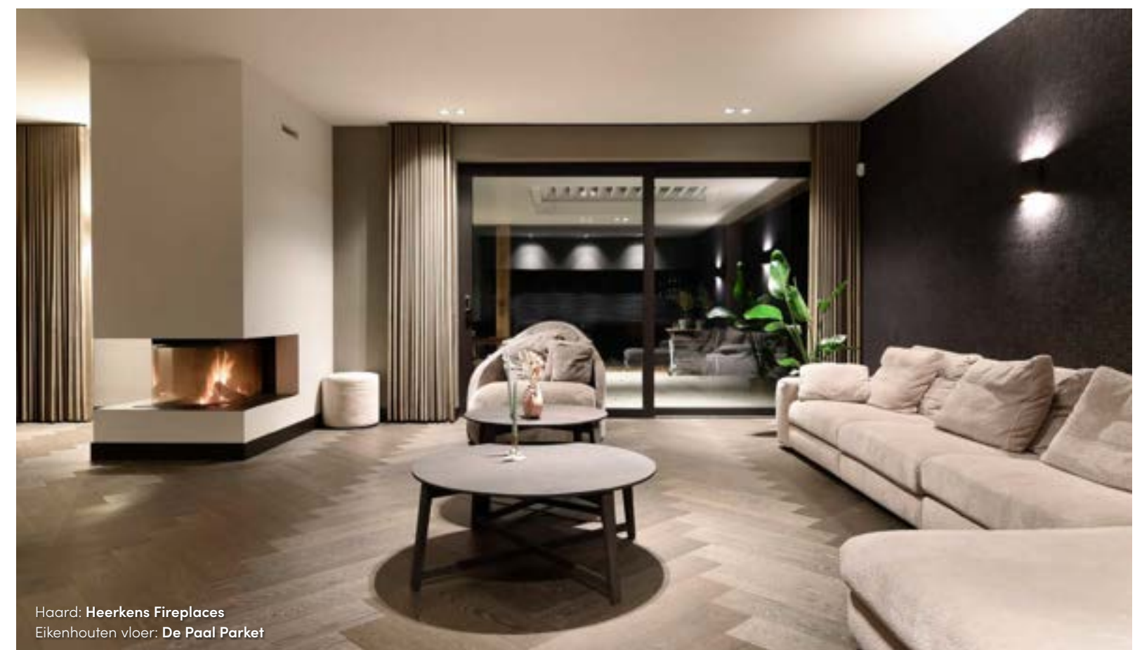
Haard: Heerkens Fireplaces Eikenhouten vloer: De Paal Parket

lets wat vaak over het hoofd wordt gezien in een ontwerp, maar wat wel volop comfort toevoegt, is akoestisch stucwerk. De keuze voor Goossens Stukadoorsbedrijf stond van meet af aan vast. "Mijn man wilde akoestisch stucwerk van Goossens in het plafond van de living en keuken. Hij had dat bij anderen gezien en raakte er niet over uitgesproken", vertelt de bewoonster. "Ik was niet meteen overtuigd, maar nu wil ik niet anders. Het geeft zo'n rust! Je hoort het verschil met een ruimte zonder akoestisch plafond, maar je ziet het niet. Ook spotjes of LED strips konden probleemloos in het plafond verwerkt worden. Bas Goossens heeft topwerk geleverd."