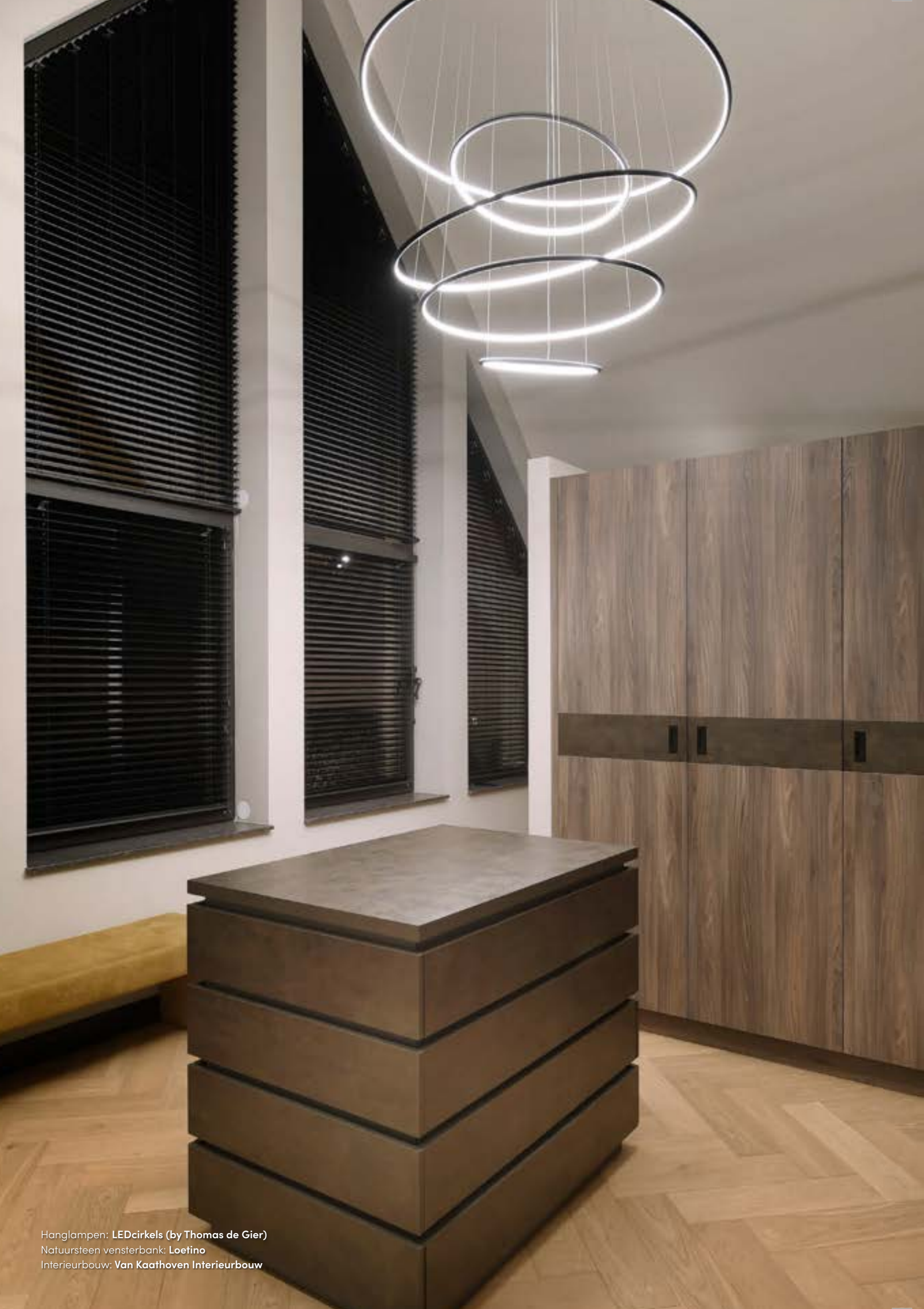
Hanglampen: LEDcirkels (by Thomas de Gier) Natuursteen vensterbank: Loetino Interieurbouw: Van Kaathoven Interieurbouw