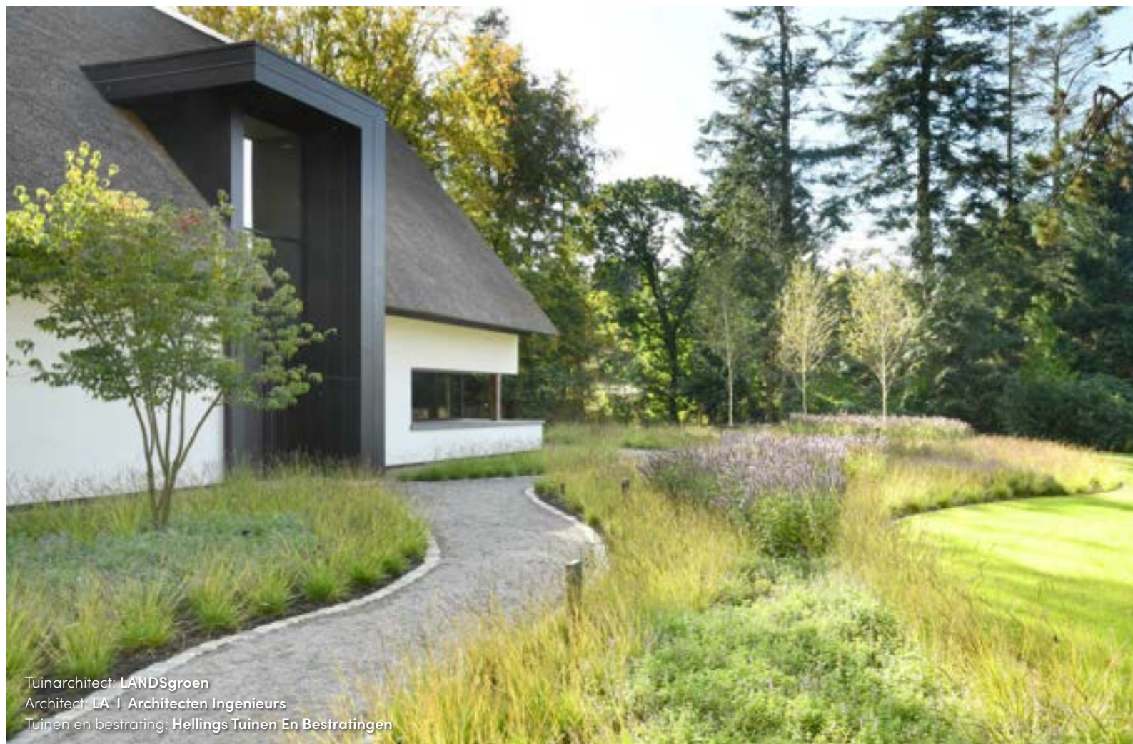
Tuinarchitect: LANDSgroen Architect: LA | Architecten Ingenieurs Tuinen en bestrating: Hellings Tuinen En Bestratingen