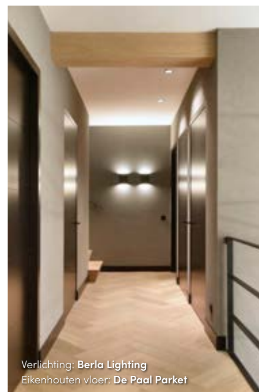
Verlichting: Berla Lighting Eikenhouten vloer: De Paal Parket