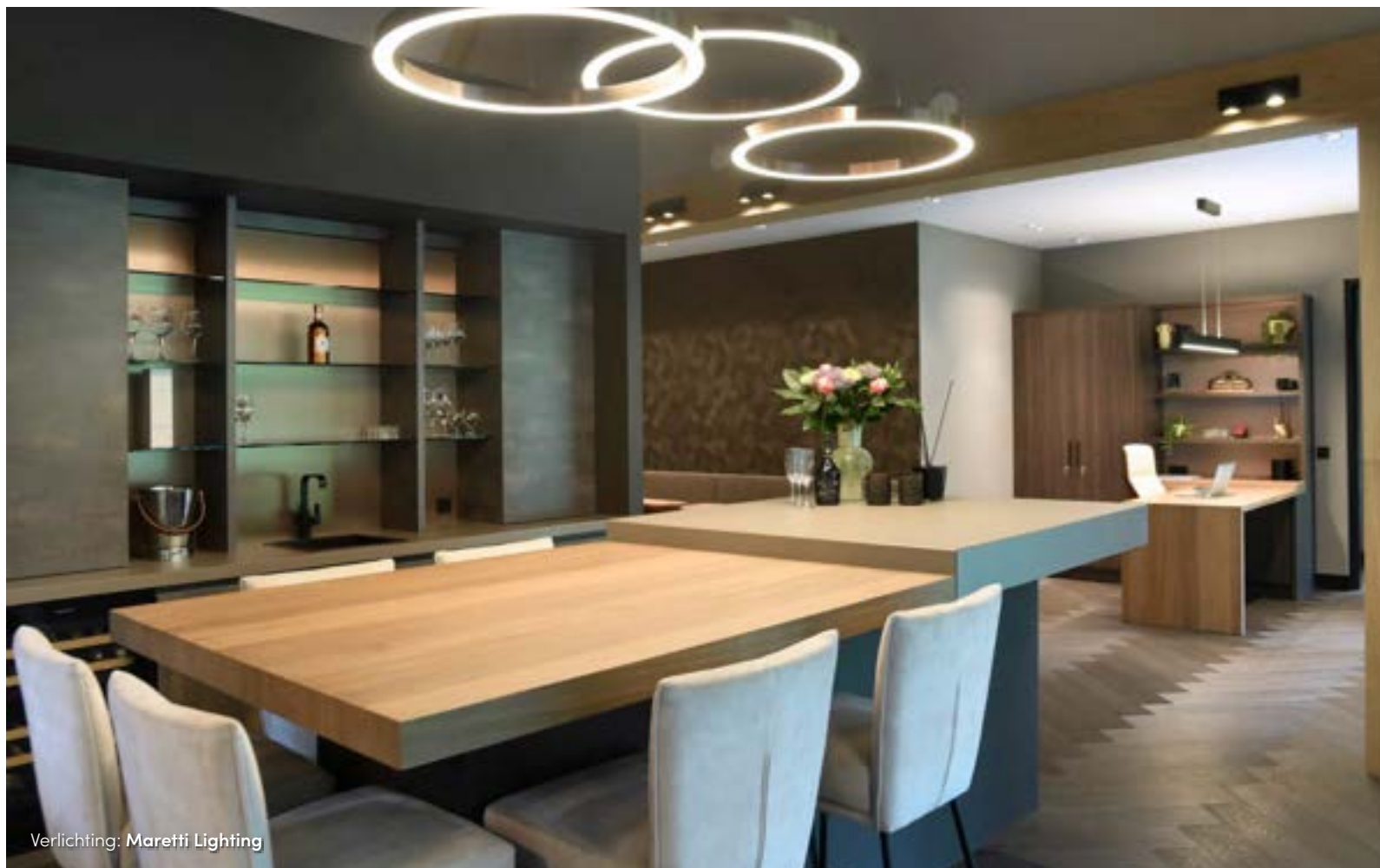
Verlichting: Maretti Lighting