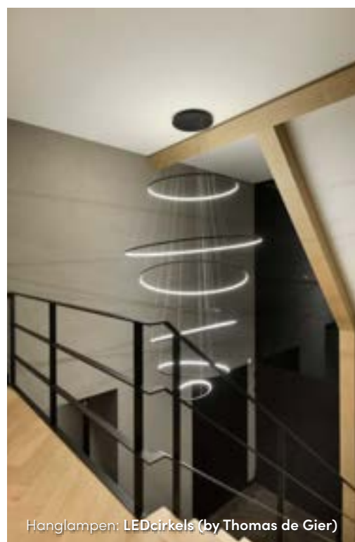
Hanglampen: LEDcirkels (by Thomas de Gier)