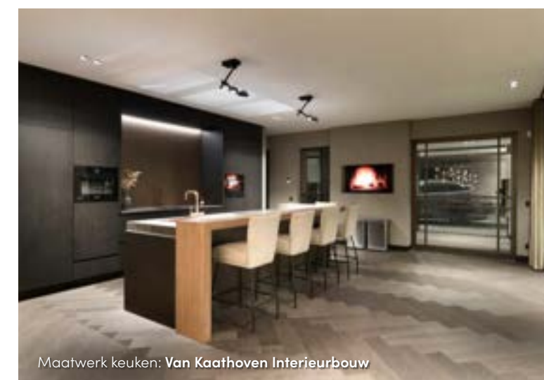
Maatwerk keuken: Van Kaathoven Interieurbouw