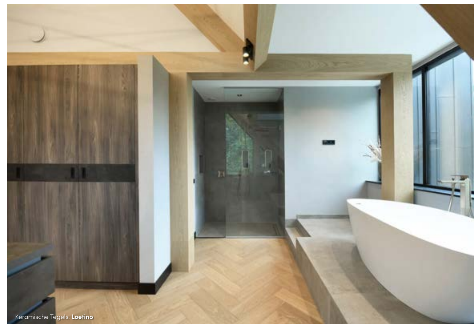
Keramische Tegels: Loetino

dak door de suite aan te kleden met houten balken." De zachte eikenhouten parketvloer van De Paal Parket, die op de gehele bovenverdieping is gelegd, straalt rust en warmte uit. Precies wat de bewoners wensten. Wanneer je om het slaapvertrek heen loopt, kom je uit in de dressing met aansluitend badkamer, waar het bad de show steelt. Meteen valt hier de kracht van het ontwerp op: de verbinding tussen binnen en buiten is royaal aanwezig.