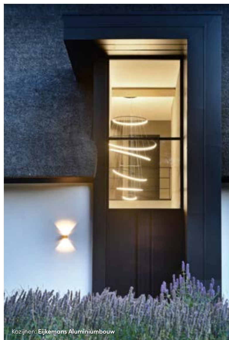
Kozijnen: Eijkemans Aluminiumbouw