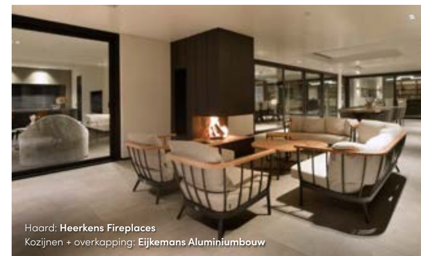
Haard: Heerkens Fireplaces Kozijnen + overkapping: Eijkemans Aluminiumbouw

De L-vorm van de woning is namelijk ontzettend gunstig; eenmaal binnen vergeet je direct dat deze woning aan een doorgaande weg ligt en heb je enkel nog oog voor de prachtige tuin en de sfeervolle leefruimtes.