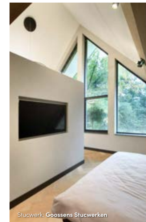
Stucwerk: Goossens Stucwerken