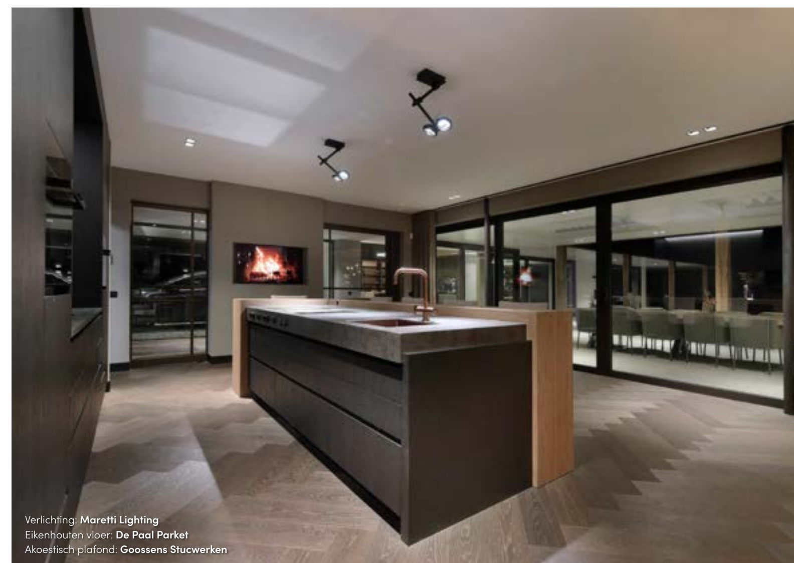
Verlichting: Maretti Lighting Eikenhouten vloer: De Paal Parket Akoestisch plafond: Goossens Stucwerken