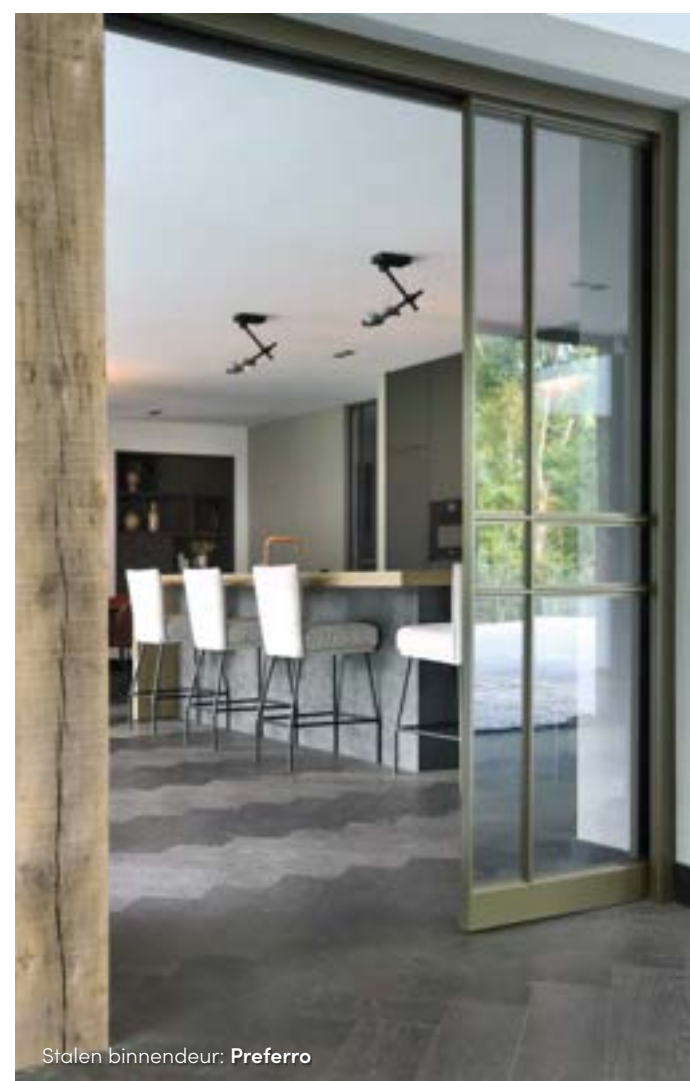
Stalen binnendeur: Preferro

stoere vloer, die ook nog eens een natuurlijk reliëf heeft, met een warme en chique afwerking, is echt heel gaaf. Het is een vloer om op slag verliefd op te worden."