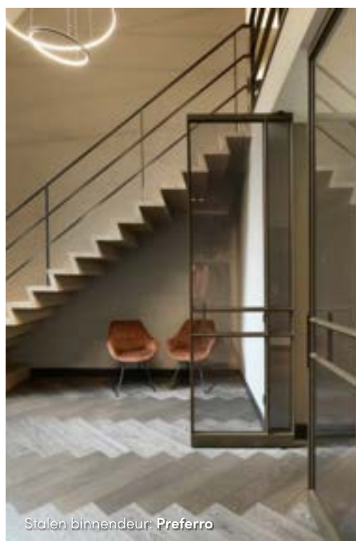
Stalen binnendeur: Preferro